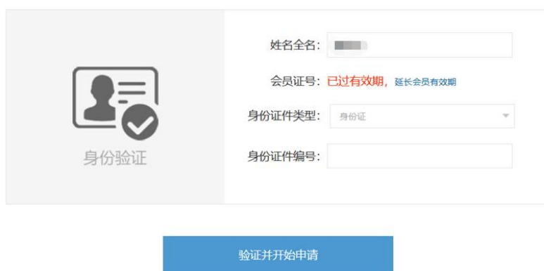
图 4 个人会员过期提示

如果点击“验证并开始申请”后，页面显示“已过有效期”（图 4），表示申请人的会员身份已经过期。可点击蓝色字体“延长会员有效期”，先缴纳会员费，成为有效个人会员后，再行申报（图 5）。