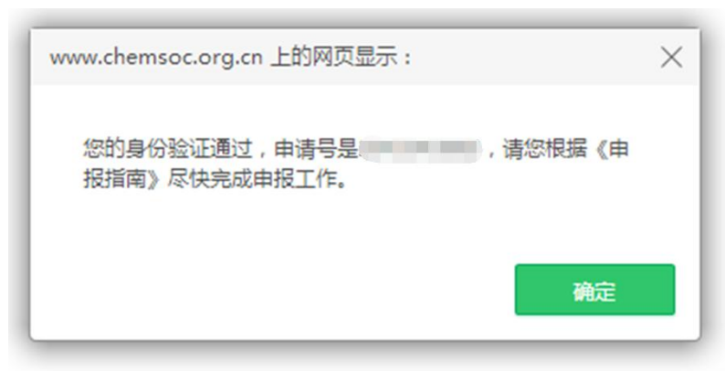
图 3 身份验证成功并获得申请号

如果点击“验证并开始申请”后，页面显示“已过有效期”（图 4），表示申请人的会员身份已经过期。可点击蓝色字体“延长会员有效期”，先缴纳会员费，成为有效个人会员后，再行申报（图 5）。