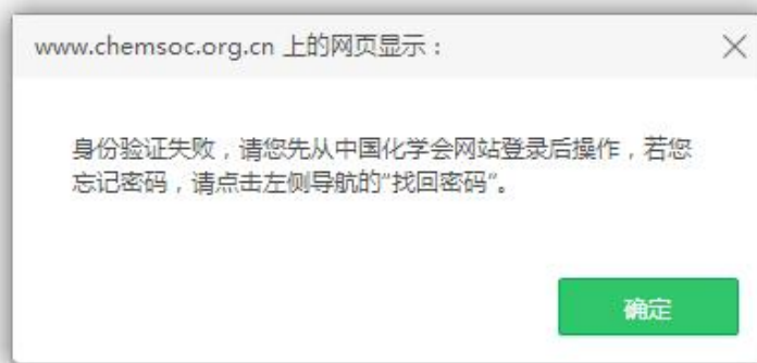
图 6 身份验证失败提示