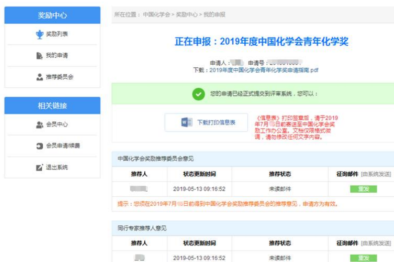
图 9 提交申请成功页面（以 2019 年中国化学会青年化学奖为例）

当提交奖励申请成功后，页面将自动跳转至“我的申报”，点击“下载打印信息表”，导出申请人的《信息表》DOCX 文件（图 9）。导出后的文档只可修改格式，文字内容需与电子版保持一致。