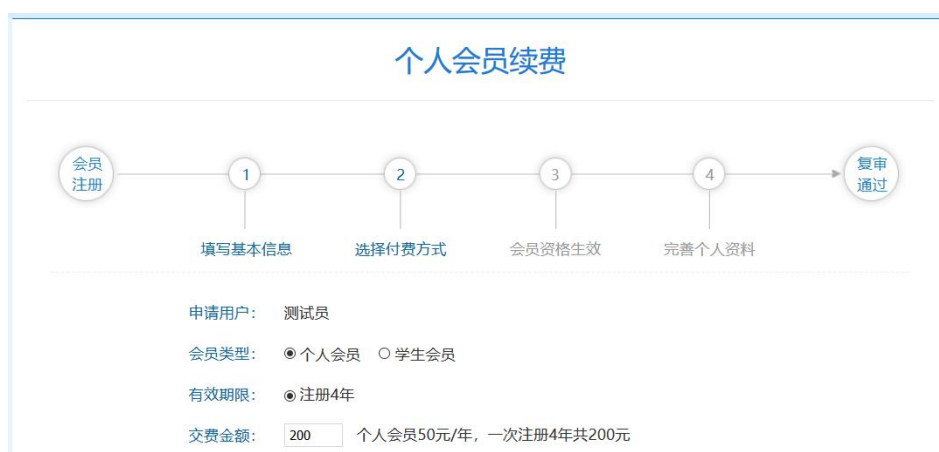
图 5 延长个人会员有效期

如果姓名、会员证号等信息输入有误，系统将提示身份验证失败（图 6）。请您确认相关信息后，再次提出申报。