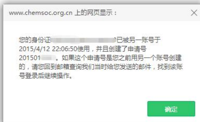
图 7 重复申报奖励提示页面

提示： 非中国化学会会员需先办理入会手续，成为个人会员后，再申报学会奖励。忘记会员证号的申请人可登录个人会员中心，查看会员证号。如果忘记登录密码，可通过注册时的邮箱和姓名重置密码。