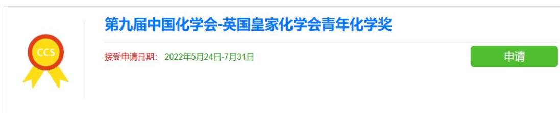
图 1 奖励申报页面

选择拟申报奖励, 点击下载“奖励条例”和“申报指南”, 仔细阅读并准备好相关材料后, 点击“申请”按钮 (图 1)。