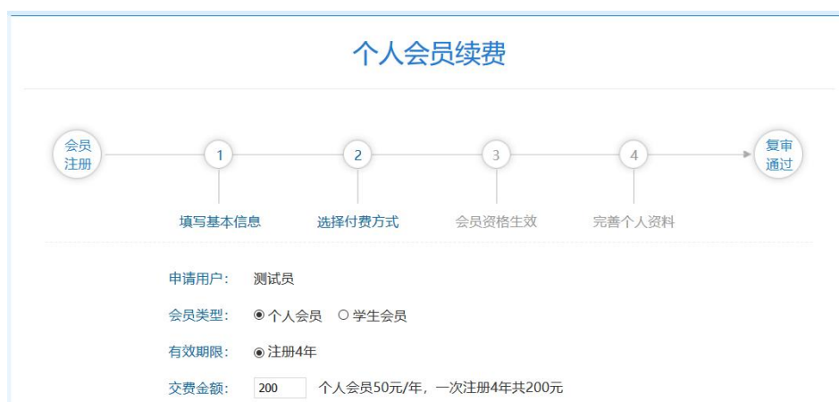
图 5 延长个人会员有效期