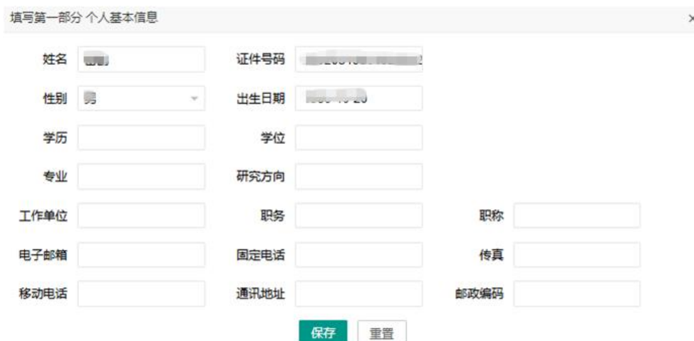
图 10 “第一部分 个人基本信息”页面

其他栏目如实填写。如无传真号码,可空白不填写,其他栏目必须填写完整。(图 10)