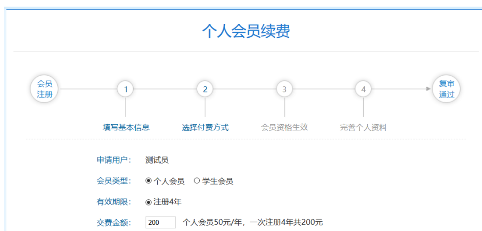
图 5 延长个人会员有效期

如果姓名、会员证号等信息输入有误，系统将提示身份验证失败（图 6）。请您确认相关信息后，再次提出申报。