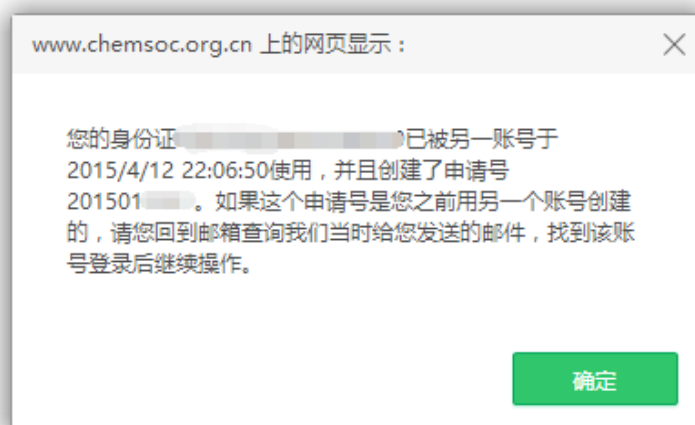
图 7 重复申报奖励提示页面

提示： 非中国化学会会员需先办理入会手续，成为个人会员后，再申报学会奖励。忘记会员证号的申请人可登录个人会员中心，查看会员证号。如果忘记登录密码，可通过注册时的 Email 和姓名重置密码。