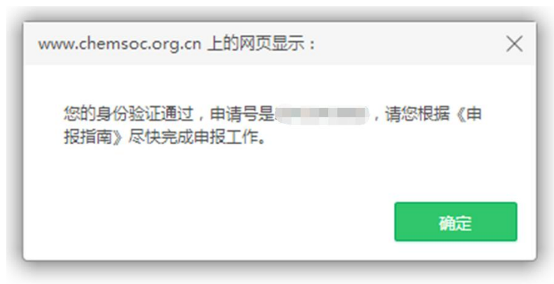
图 3 身份验证成功并获得申请号

如果点击“验证并开始申请”后，页面显示“已过有效期”（图 4），表示申请人的会员身份已经过期。可点击蓝色字体“延长会员有效期”，先缴纳会员费，成为有效个人会员后，再行申报（图 5）。