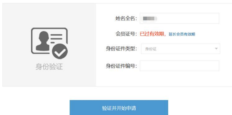
图 4 个人会员过期提示

如果点击“验证并开始申请”后，页面显示“已过有效期”（图 4），表示申请人的会员身份已经过期。可点击蓝色字体“延长会员有效期”，先缴纳会员费，成为有效个人会员后，再行申报（图 5）。